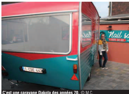
C'est une caravane Dakota des années 70.